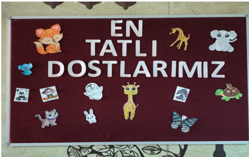
MEHMET AKİF ERSOY İMAM HATİP ORTAOKULU